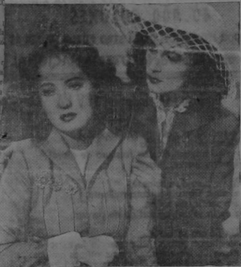
Merle Oberon y Geraldine Fitzgerald, en una escena de la Warner Bros titulado: "La Última Cita" o "Reunión de Almas".

que se pobres representa uras: CC y hay este el otro la nes, to es del ran r memon esas pr de ha ficion n y al de ad ram pobres nara memon esas pr de ha ficion n y al de ad ram pobres nara memon esas pr de ha ficion n y al de ad ram